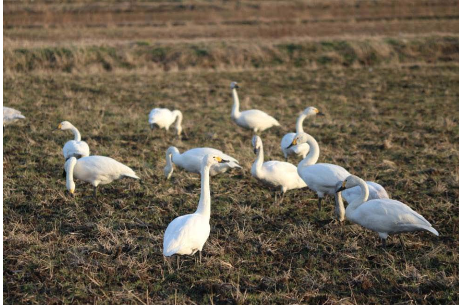
夏目の堰（東庄町）